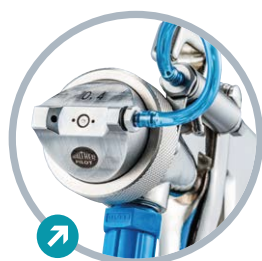
Hlava vyrobena z nerez oceli

Optimální ergonomický tvar (vhodné pro praváky i leváky)